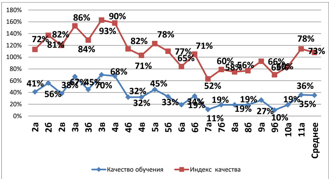
Оценочная плоскость показателей качества обучения по годам обучения 2022-2023 учебный год